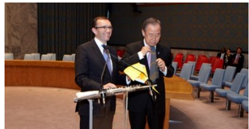
Daværende utenriksminister Espen Barth Eide gir FNs generalsekretær Ban Ki-Moon et slips med Poulssons design under gjenåpning av Sikkerhetsrådssalen i 2013.

Salen gjennomgikk i 2013 en omfattende renovering og teknisk oppgradering, hvor Poulssons tekstiler ble for 1,4 millioner kroner. Under den offisielle gjenåpningen overrakte utenriksminister Espen Barth Eide et slips laget av Poulssons tekstiler til FNs Generalsekretær Ban Ki-Moon.