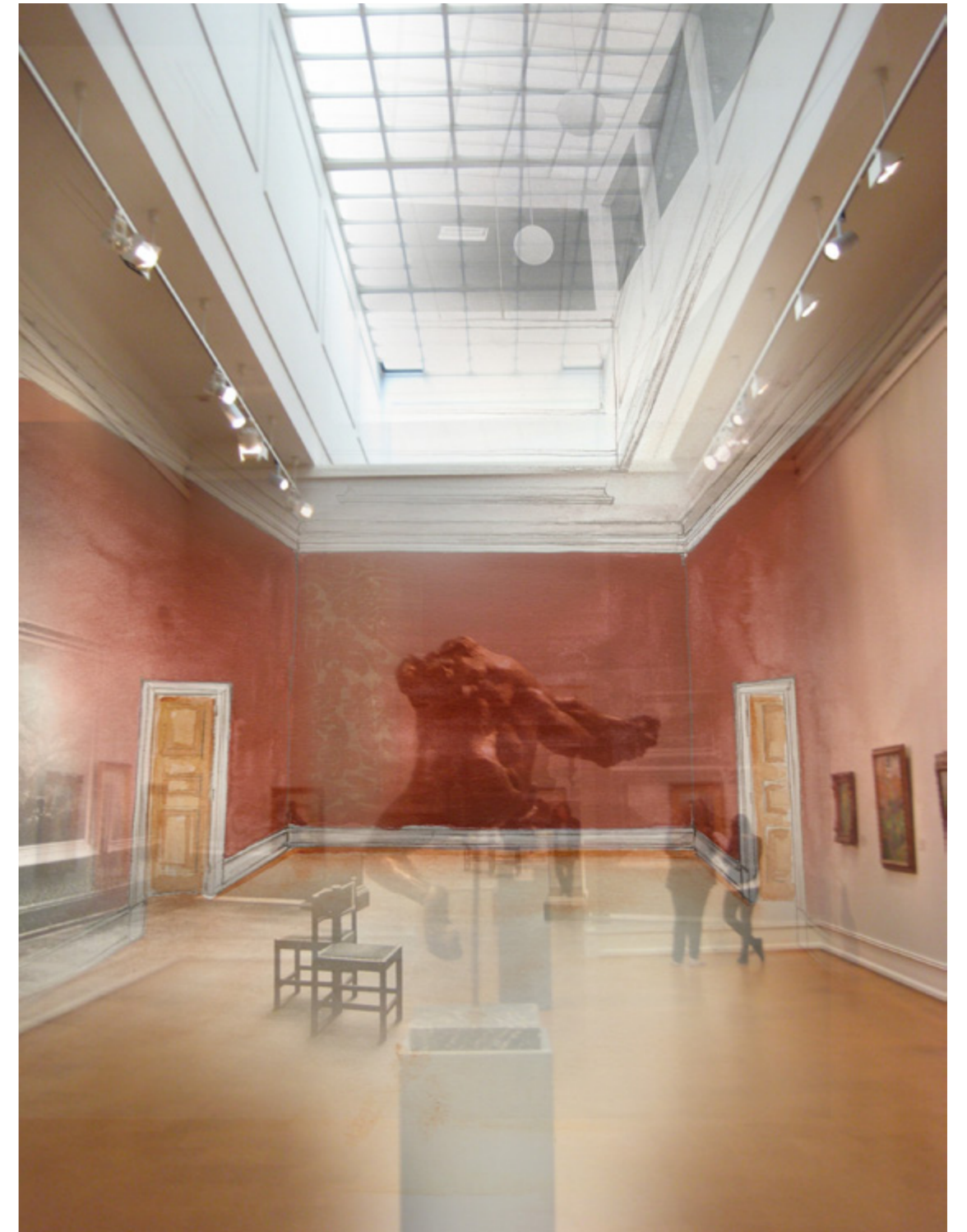
Illustrasjonen viser en collage av foto og skisser av rommet jeg har jobbet med i Nasjonalgalleriet. Spor og minner i arkitekturens mange lag.

Fenomenene oppstår via bevegelse i rom og mellomrom, der materialitet og formspråk fordrer til handlinger der det i møtet mellom gammelt og nytt oppstår rom man kan gjenkalle stemningen i. Opplevelsen av det nye og det historiske setter seg i kroppen og i erindringen.