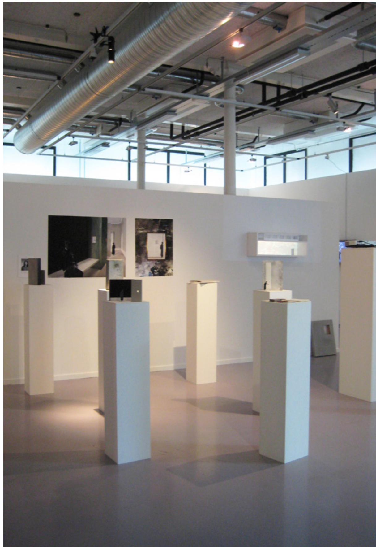
Bilder fra avgangsutstillingen hvor jeg stilte ut masterprosjektet mitt. Materialer og modeller ble utstilt på søyler som ble plassert for å bidra til en romlig opplevelse, hvor bevegelsene i dette rommet gjenspeiler konseptet med at bevegelse + materialitet = fornemmelsen av fravær.

Det ferdige prosjektet fremstilles som kun én av mange mulige løsninger. Dette understreker at prosjektets egentlige resultat er metodikken og ikke et interiørutkast. Uten å være bokstavelig klarer prosjektet å gi assosiasjoner og gjenklang av museets historie, innhold, stemning og opplevelse samtidig som ny bruk også tar sin egen plass. Fortid og fremtid samtidig -et nærvær av fravær.