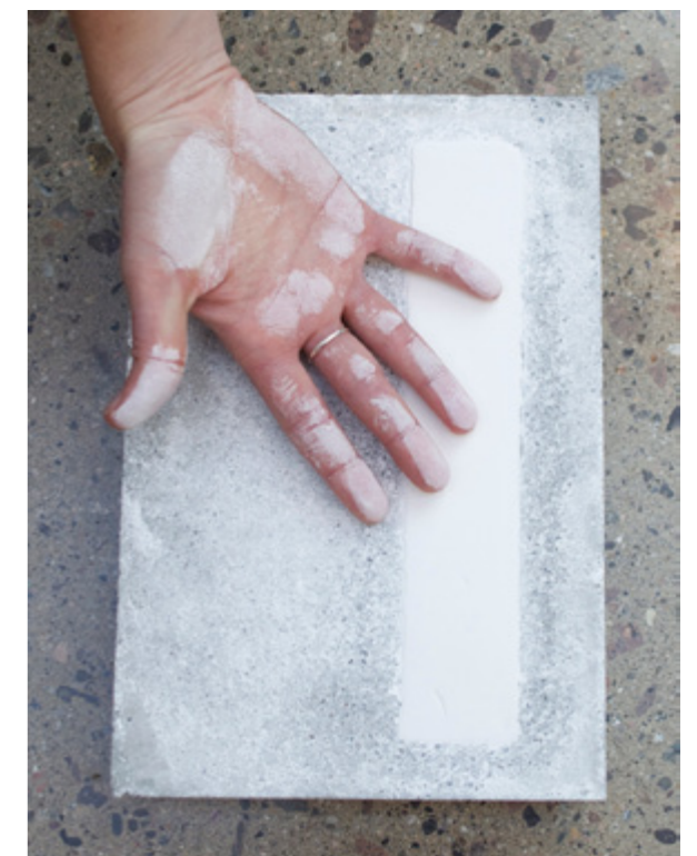
Små nisjer fylt med gips. Man berører det myke, glatte materialet. Fingrene blir hvite og tankene går til de gamle gipsavstøpningene som opprinnelig hadde sitt hjem i Nasjonalgalleriet.