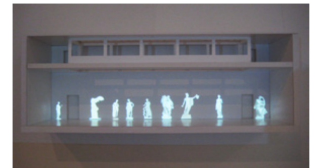
Projisering i modell av rommet. Hvordan formidle et interiørprosjekt som handler om fenomener og immaterielle kvaliteter? Jobbet med formater og måter jeg kunne formidle prosjektet på. Motivasjonen er å gi betrakteren en opplevelse av prosessen, prosjektet og kanskje også en fornemmelse av fraværet i form av levende bilder.